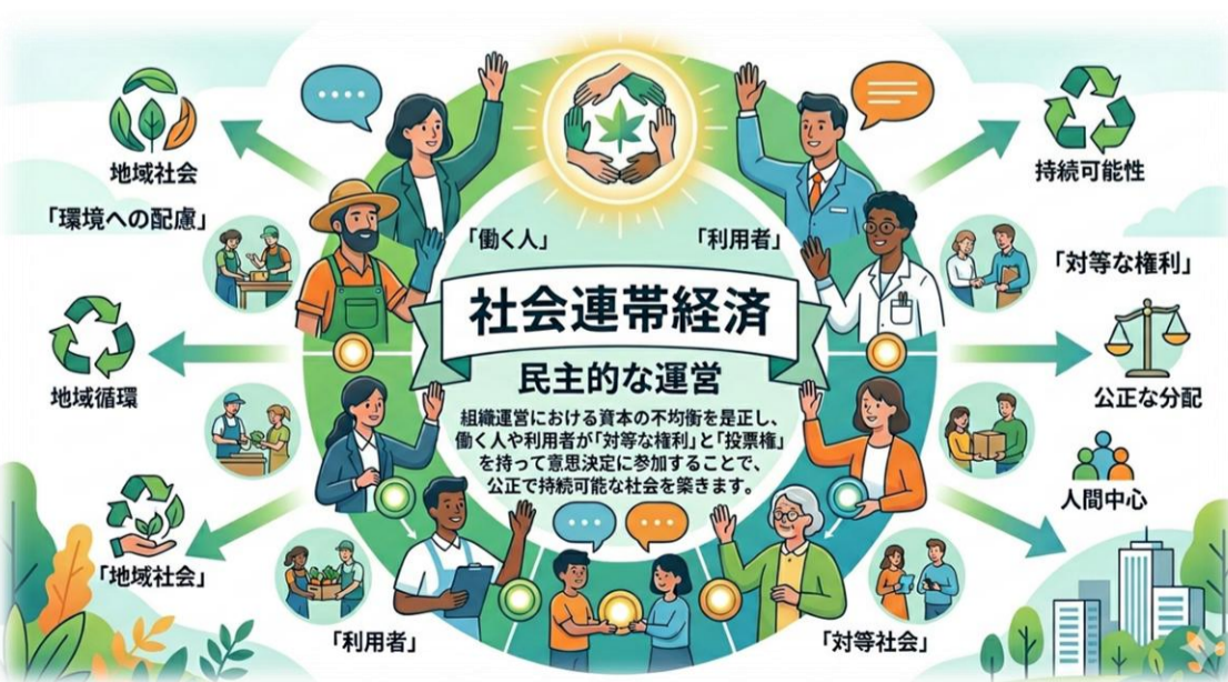
SSE (社会的連帯経済) のイメージ