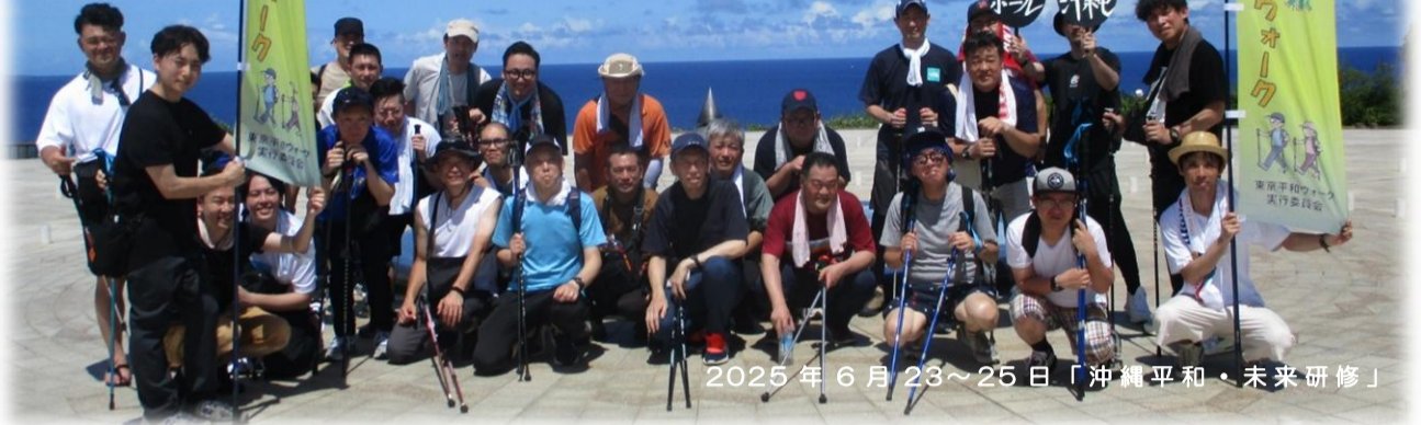
2025年6月23~25日「沖縄平和・未来研修」

すべての輸送サービスに携わる仲間と家族の「働き方」と「暮らし」を創造し、職場活動を原点に、地域社会との広い連帯で、私たちの総合労働政策を実現し、グリーンな地球環境と平和な地域共生社会の実現に向けて JTSU 運動を推し進めよう!